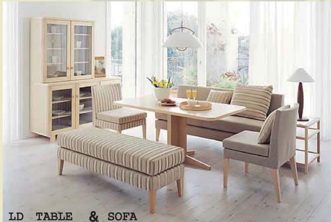
LD TABLE & SOFA

家で食事をする機会が多く、長時間をダイニングで過ごすファミリーには、ダイニングとソファの機能を兼ねた「LDテーブル&ソファ」。ゆったりと食事ができ、TVを見ながら団らんします。